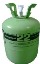
Refrigerante R-22 NO ECOLOGICO

Desde su reconocimiento inicial en 1928 y su comercialización en 1936, el Refrigerante 22 (R-22) ha sido aplicado en sistemas que oscilan desde los más pequeños Acondicionadores de Aire de ventana, hasta los más grandes Congeladores, Chillers, Manejadoras Centrales de Expansión Directa, etc.