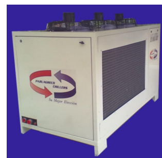
Chiller de 20 ton, Ecológico R-407c ParlagrecoChillers

ParlagrecoChillers Pone a su Disposición Chillers Ecológicos