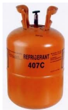
Refrigerante R-407C ECOLOGICO

(ecológicos) se da en ámbitos Industriales para Plantas que ostentan la calificación ISO por medio del compromiso de la "Preservación del Medio Ambiente".