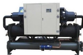
Eq. Chiller con Refrigerante R-22

Todos estos equipos de R-22 se pueden convertir en equipos de R-407C mediante un proceso técnico especializado, con lo que, quedarían actualizados para operar muchos años mas, acorde a su vida operacional.